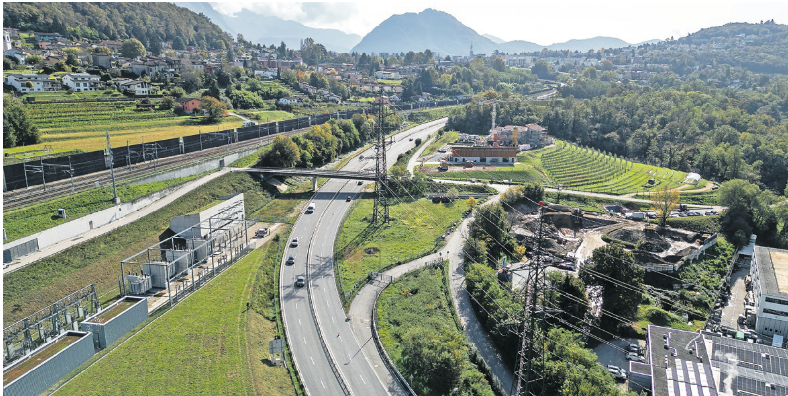
L'area interessata dal progetto. Sullo sfondo la masseria Gerbone, che l'OTAF ha quasi terminato di ristrutturare.